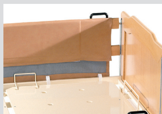
Обивка на боковые ограждения (код 101182PRO)