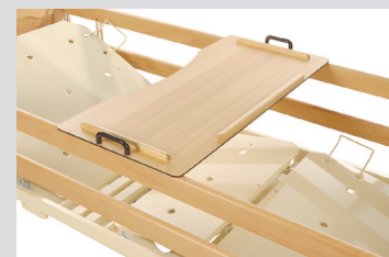
Столик для чтения и еды (размещение на боковых ограждениях)